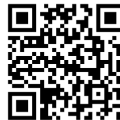
図書館資料検索画面

マイライブラリの使用法は、SENZOKUポータル「Q&A・使い方」 -「図書館ガイド」-「マイライブラリ」を参照下さい。